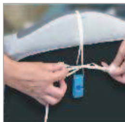
Estrema facilità di montaggio.