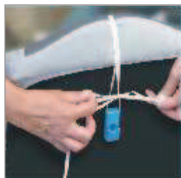
Estrema facilità di montaggio.